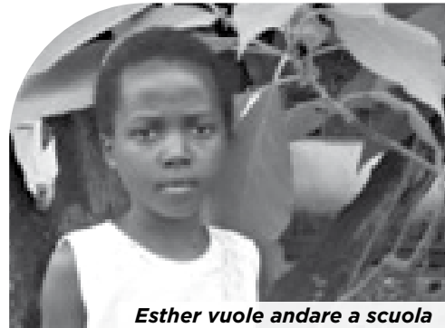
Esther vuole andare a scuola

Il direttore è disposto ad accogliere Ester in quarta primaria, purché paghi le tasse scolastiche (che serviranno soprattutto per lo stipendio degli insegnanti, poiché lo stato non vi provvede).