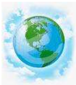
A cura del Comitato internazionale per il Contratto Mondiale sull'Acqua e il diritto alla vita.

BM e FMI sostengono che i beni naturali sono beni comuni e appartengono agli Stati e ai Popoli. Nel momento in cui l'acqua è prelevata e trattata, per loro diventa un bene economico, perché il costo implica un valore che sarà successivamente determinato dal mercato. Ecco che l'acqua, da bene comune, diventa merce la cui gestione viene conferita ai privati.