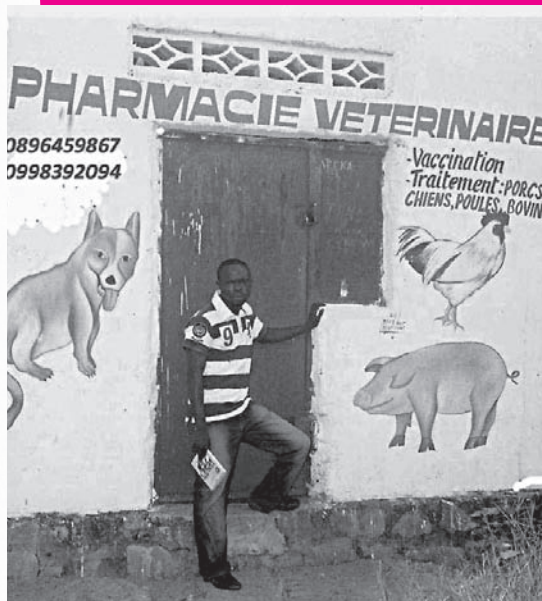
La prima farmacia veterinaria a Kinshasa.

Pomodori freschi dalle cooperative di giovani contadini di Mboko.