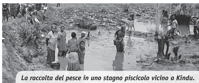
La raccolta del pesce in uno stagno piscicolo vicino a Kindu.