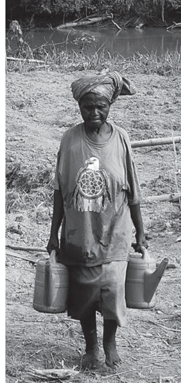
Io, donna di Shabunda!

Altri benefici per la collettività riguarderanno infine l'abbassamento degli esorbitanti prezzi dei prodotti alimentari dovuti all'isolamento della città.