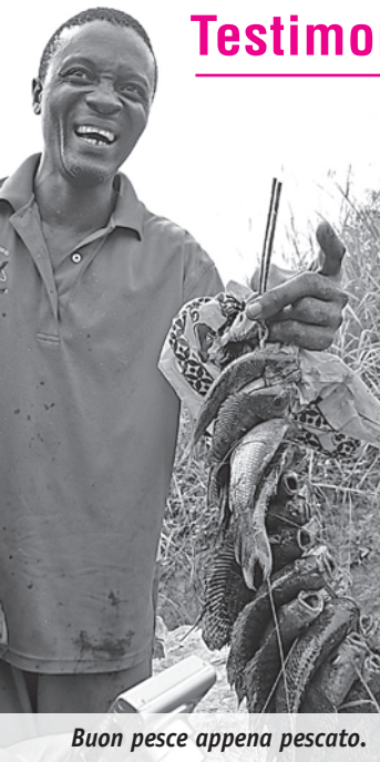
Buon pesce appena pescato.