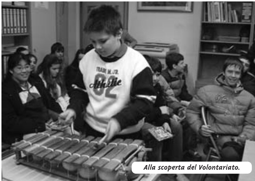
Alla scoperta del Volontariato.

◆ "Alla scoperta del Volontariato". Come ogni anno il primo sabato di marzo abbiamo accolto i ragazzi di alcune classi seconde della scuola media di Cittadella, in visita alle associazioni di volontariato della città.