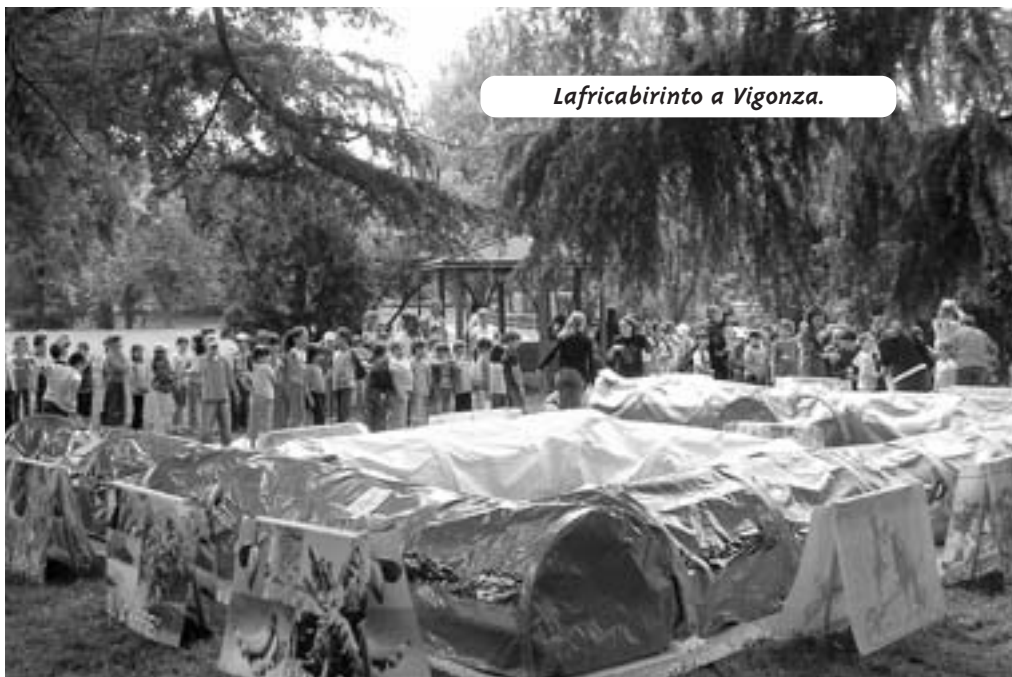
Lafricabirinto a Vigonza.

◆ Lafricabirinto. Incontro fra i Popoli domenica 13 maggio ha dedicato una piazza di Bassano del Grappa ai bambini e ai ragazzi di ogni età: un colorato labirinto in cui avventurarsi per incontrare e scoprire l'Africa.